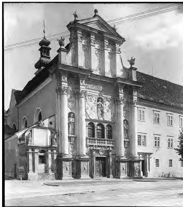
Baročno pročelje ptujske minoritske cerkve, med leti 1941 in 1944 (PMPO, fototeka Kulturnozgodovinskega oddelka, NS-1048)

Postopni obnovi prezbiterija, ki se je vlekla skozi desetletja in je bila zaključena šele na začetku tega tisočletja, so za osnovo služile ohranjene stene. Po njihovi sanaciji na začetku 50. let so ob