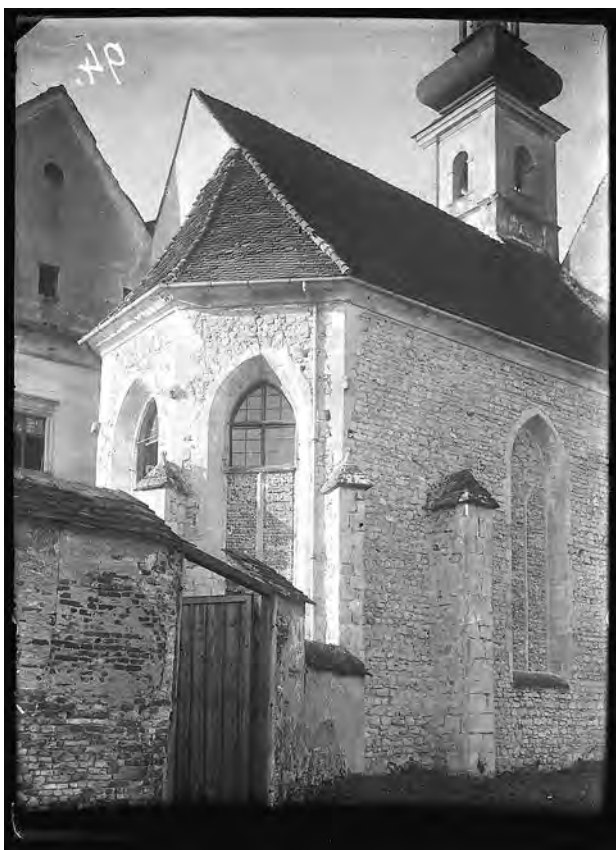
Zgodnjegotski kor ptujske minoritske cerkve, leta 1930

Med obnovitvenimi deli leta 1930 so odbili omete tudi na zunanjščini prezbiterja in v severni steni odkrili zazidano okno z bogatim krogovičjem in v zidu profile nekdanje obočne arhitekture zgodnjegotskega kora. Po tem, ko so odstranili beleže z vseh kamnitih delov obočnega sistema, ki so ga pustili v naravni barvi kamna, so leta 1932