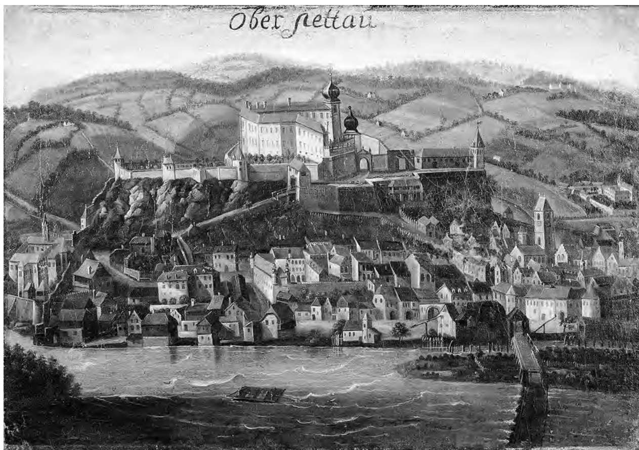
Gornjeptujski grad in mesto Ptuj s pogledom na samostan z jugozahodne strani, med letoma 1702 in 1705 (samostan je upodobljen na jugovzhodnem delu slike; PMPO, inv. št. G 829s)

Skica samostana iz leta 1641 je pomembna predvsem zato, ker kaže, da sta v cerkev vodila dva portala: glavni na zahodni, pročelni strani cerkvene ladje, in stranski, ki je bil v severni steni ladje. Pomembnejši je Creiztallerjev načrt iz leta 1644, ki kaže, da sta samostansko cerkev sestavljala dolga pravokotna ladja in 5/8 zaključeni dolgi kor, ki so ga obdajali zunanji oporniki. Na jugovzhod-