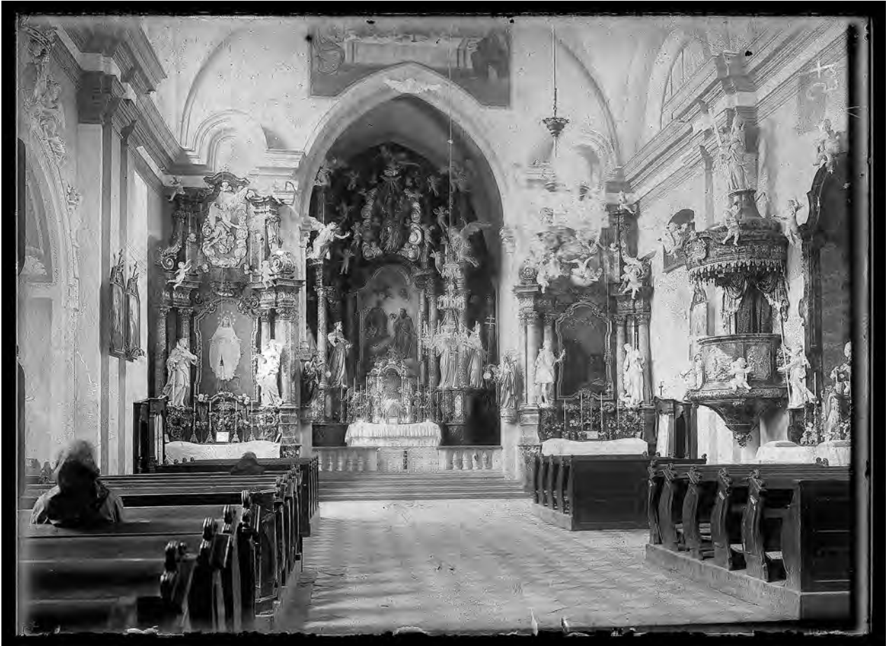
Notranjost cerkvene ladje s pogledom proti slavoloku, po letu 1931