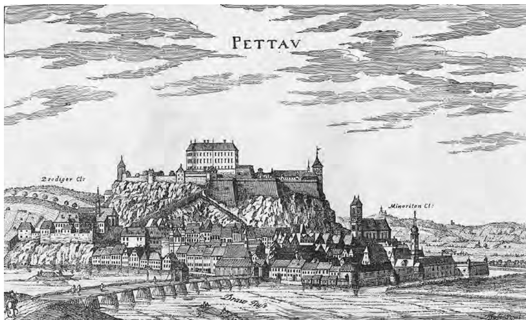
Ptujski minoritski samostan na Vischerjevi veduti Ptuj, 1681 (jugovzhodna stran; Vischer: Topographia Ducatus Stiriae 1681, slika 85)