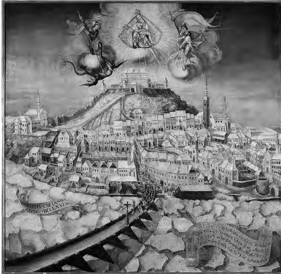
Fellnerjeva slika Ptuja s pogledom na samostan z jugozahodne strani, 1766 (samostan je upodobljen na jugovzhodnem delu slike; PMPO, inv. št. G 120s)

dnem stiku cerkvene ladje s prezbitarijem je prislonjen pravokotni zvonik, severnega portala ni videti, vendar je v notranjosti ladje mogoče videti temelja stebrov zahodne pevske empore. Podoben Stierov načrt iz leta 1657 kaže, da naj bi bila cerkvena ladja triladijska in obokana, vendar to ne drži, ker je imela enoladijska dvoranasta prostornina raven lesen strop in je bila obokana šele leta 1686. Z Vischerjeve vedute Ptuja iz leta 1681 lahko razberemo le to, da je bila dvokapna streha cerkvene ladje višja od prezbitarija, zahodno pročelje cerkve je bilo trikotno zaključeno, medtem ko so bile v njem tri manjše odprtine, ki so osvetljevale cerkveno podstrešje. Nekoliko bolje je vidno zahodno pročelje na upodobitvi Gornjega Ptuja, ki kaže visoki, šilastoločno zaključeni portal, nad njim dve večji, pravokotno ali polkrožno zaključeni okni in v vrhu okroglo okence. V južni steni ladje sta nakazani dve večji polkrožno zaključeni okni. Končno lahko na veduti Ptuja z oltarne slike